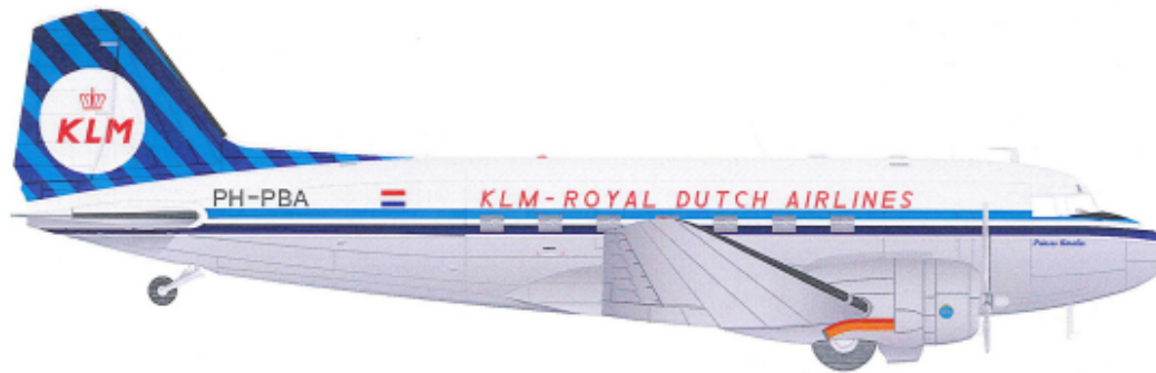
Douglas DC-3 PH-PBA Prinses Amalia