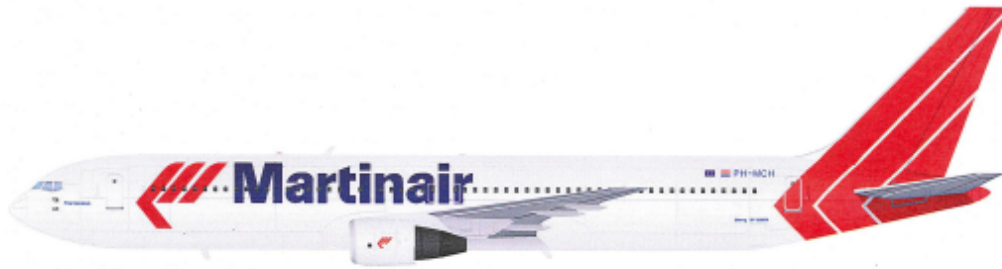
Boeing 767-31A(ER) PH-MCH Prins Constantijn (in 2009 verschroot)