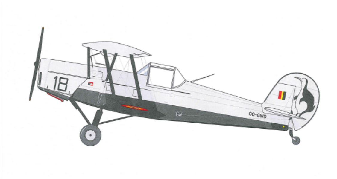
Stampe SV-4 het bekendste Belgische vliegtuig